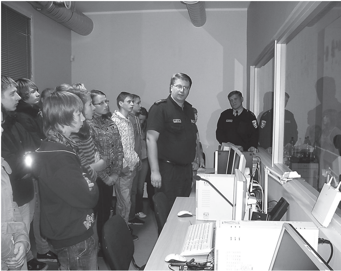
Krootuse kooliõpilased Lõuna-Politseiprefektuuri juhtimiskeskuse tööd jälgimas.