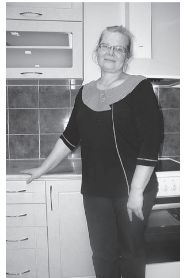
Ele on töötanud käsitööõpe- tavana 30 aastat, kuid nii head ja ilusat klassi pole tal seni veel olnud.

Käesolev klass sai teoks tänu projektile, mida toetas MTÜ Põlvamaa Partnerluskogu PRIA Leader Eesti meet- mest. Käsitööklassi projekti valmistas ette ja viis ellu MTÜ Krootuse Kultuuriselts.